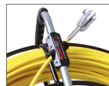
Automat. odvíjecí brzda